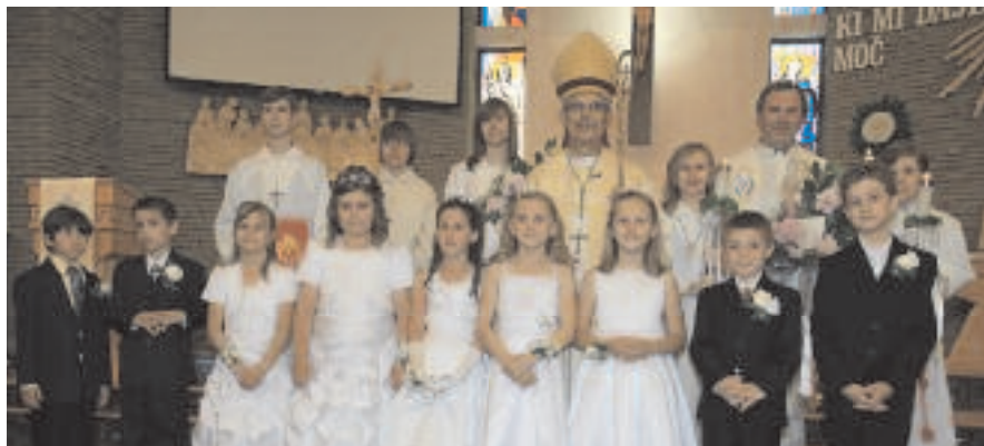
Birmanci in prvoobhajanci z župnikom in škofom, v Hamiltonu

pomočjo mnogih pridnih ljudi vsestransko uspela.