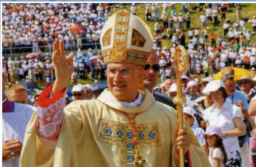
Kardinal Tarzicijo Bertone, papežev legat na slov. evharističnem kongresu

K ot živa reka so romarji prihajali na celjski stadion Arena Petrol. Večina je prišla s 410 avtobusi , 3.500 jih je na pri-zorišče prispelo z 8 vlaki , preostali romarji pa so na slovenski evharistični kongres in na beatifikacijo prvega slovenskega mučenca prišli peš, s kolesi ali z osebnimi avtomobili .