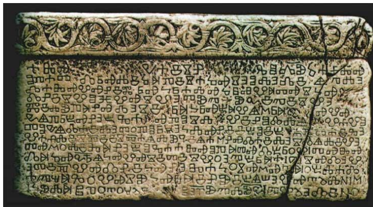
Glagolica: the oldest known Slavic script (stone from Croatia)

Ni natančnih podatkov, ali sta bila brata Ciril in Metod Slovana oziroma mogoče celo grškega in slovanskega rodu ali le Grka, ki sta se naučila slovanskega jezika.