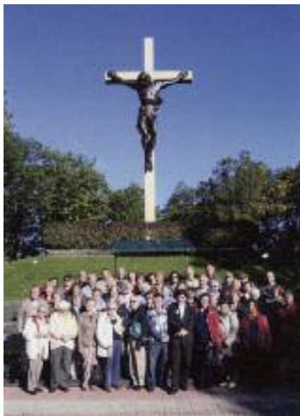
Romarji Torontskega avtobusa

V nedeljo, 26. septembra dopoldne, so si udeleženci ogledali znamenitosti otoka Mackinac, ki leži nasproti mesta Saint Ignace, zlasti staro cerkev Sv. Ane z muzejem pod