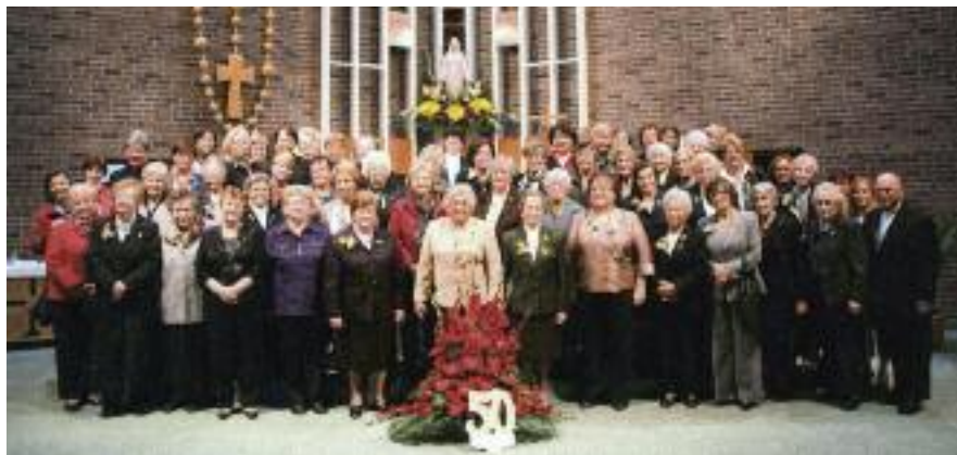
Skupinska slika ob praznovanju 50-letnice Katoliške ženske lige