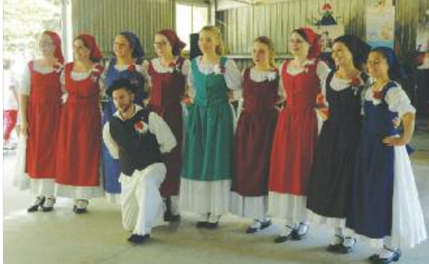
Plesalci plesne skupine Marjetice v Montrealu