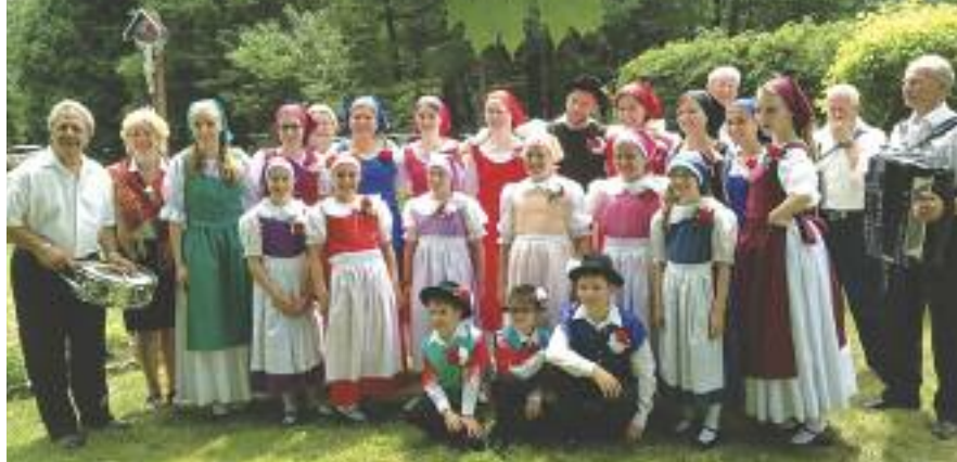
Nekateri nastopajoči na Slovenskem dnevu v Montrealu

tako zavarovana s teritorijem, marveč jo bomo morali varovati prav s skupnimi vrednotami in z vero oz. z lastno občestveno in nacionalno obliko verovanja in hrepenenja ter z negovanjem in ustvarjanjem lastne zgodovine in kulture, ne glede na to, kje živimo.