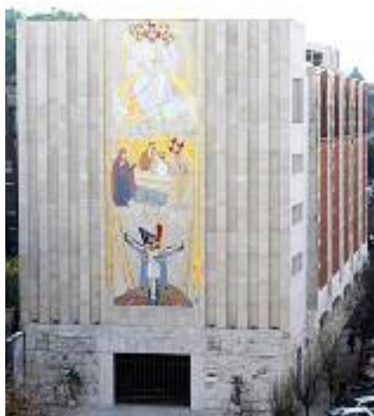
“Cerkev Naše gospe Presvetege zakramenta in kanadskih mučencev, Rim-Italija.” “Križanje – Kristus s Kanadskima mučencema.”

Vsako leto je ubitih več kot 100 tisoč kristjanov, kar pomeni, da vsake 5 minut zaradi svoje vere umre en kristjan. Poleg tega so kristjani preganjani in zapostavljeni tudi na druge načine. Na sprejemu diplomatskega zbora pred nekaj leti je papež Benedikt XVI. dejal, da 75 odstotkov vseh verskih preganjanj po svetu zadeva kristjane. Papež Frančišek pa je večkrat poudaril, da so kristjani v težji situaciji kot v času preganjanj v prvih stoletjih po Kristusu.