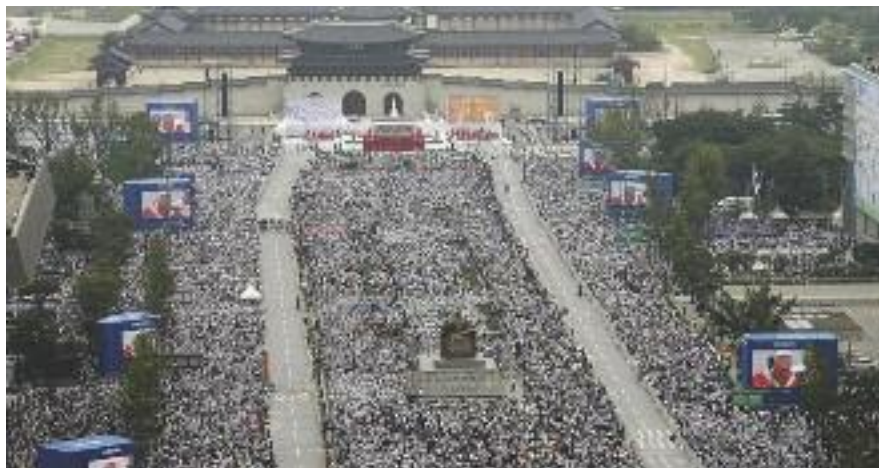
Pri sveti maši s papežem Frančiškom v Južni Koreji

Velik del papeževega govora mladim objavljamo v nadaljevanju.