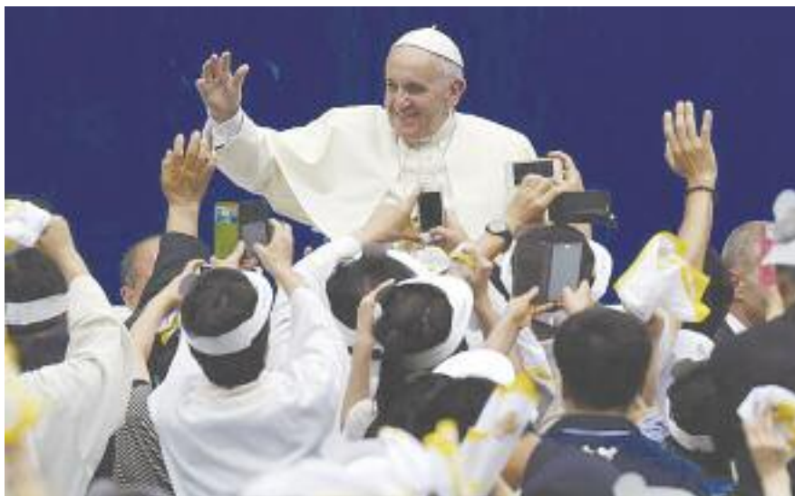
Papež Frančišek med mladimi v Južni Koreji