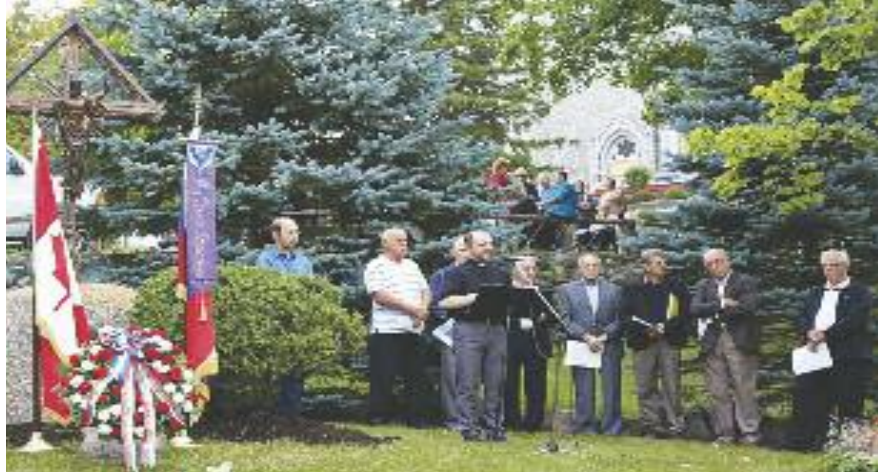
Slovesnot pri križu v Midlandu

Proščenje in Pomurski dan je pripravilo društvo Večerni zvon 17. avgusta. Veliko ljudi se je zbralo za sv. mašo, prav tako za okusno kosilo in nato še za program. Nastopili so plesalci skupine Mladi glas, igral pa je ansambel Murski val.