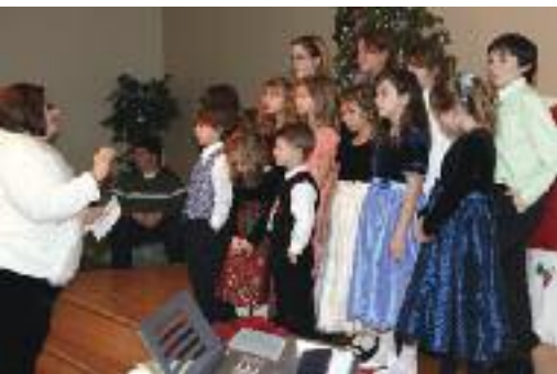
Otroški pevski zbor v klubu Sava