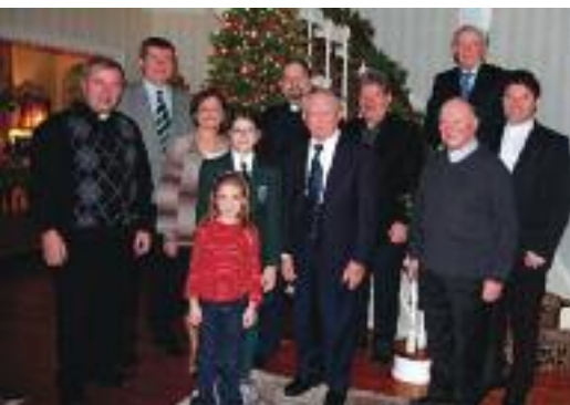
Na obisku pri veleposlaniku

Štefanovo - Lipa Park • V nedeljo, 26. decembra smo se ob štirih popoldne, po vsakoletni navadi, zbrali k sveti maši v društveni dvorani Lipa parka. Vsi so po svojim močeh sodelovali s petjem slovenskih božičnih pesmi, kuharica pa je po maši pripravila dober čaj in potico, da smo se še okrepčali in poklepali. V Sloveniji je ta dan tudi blagoslov konj zelo slovesno.