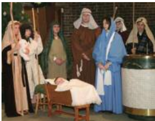
Sveta družina in pastirji