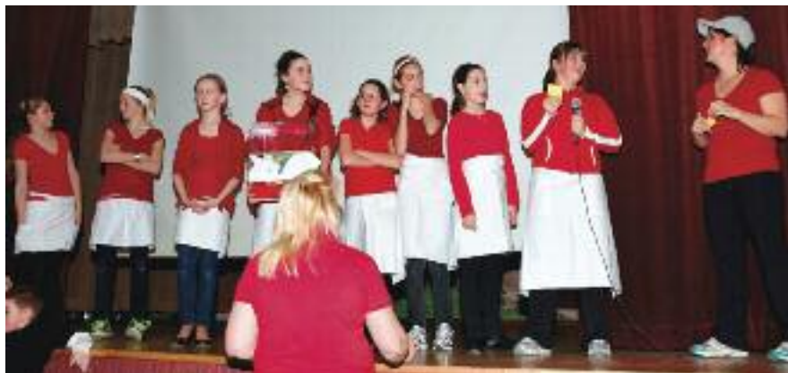
Catholic Girl's Club in 'Spaghetti Dinner'

maši začeli prihajati gostje, se je takoj naredila dolga vrsta, ki pa je hitro kopnela. Mize so se napolnile in v potrebno je bilo dodati nove.