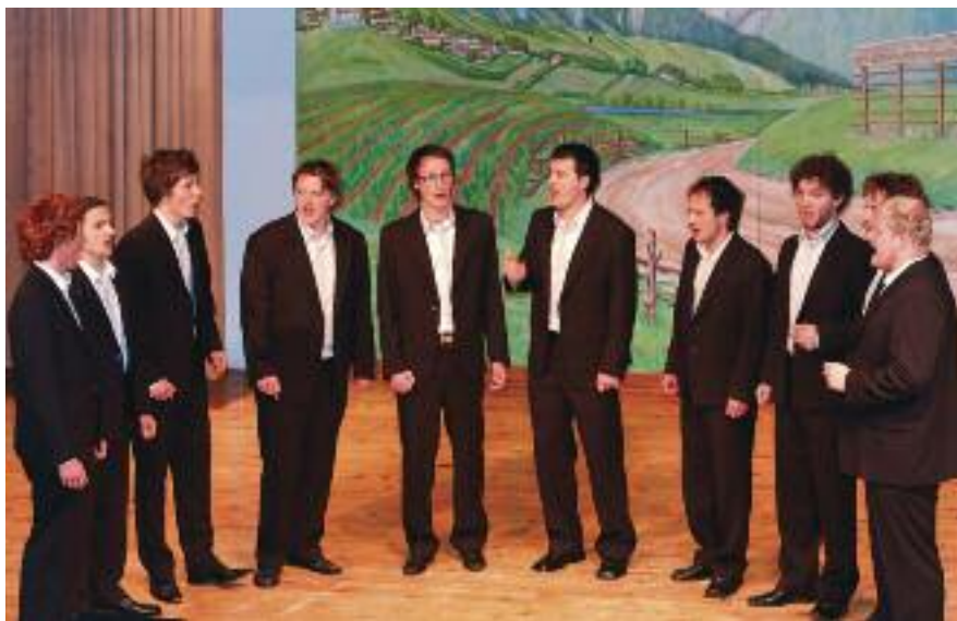
Saleški študentski oktet