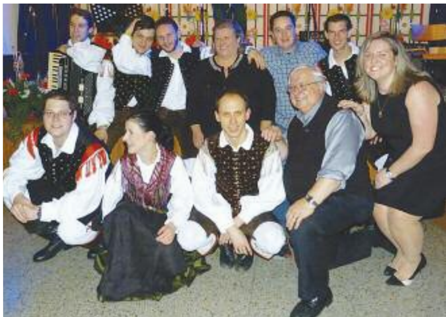
Ansambel Saša Avsenika tudi v Montrealu

dve nedelji bilo mnogim skoraj nemogoče priti k maši v našo cerkev, zaradi močnega sneženja. Mraz januarja je verjetno tudi nekatere zadrževal, da se niso ob nedeljah podali na pot k maši.