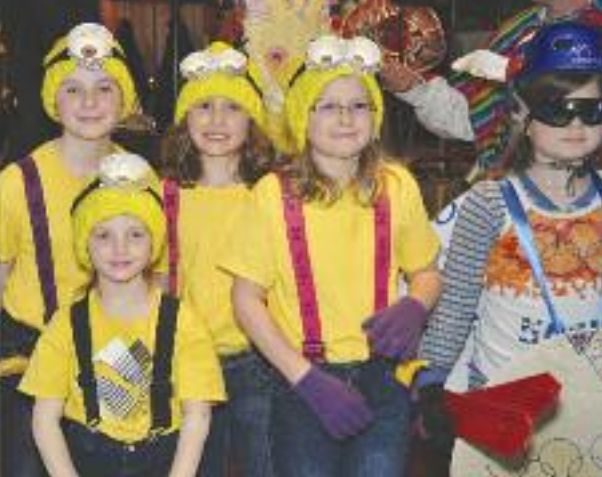
Iz pustovanja 2014

jaslice, doživete svete maše in drugo je obogatilo vsakega, ki nas je obiskal. Gloria-slava se je Bogu v nebesih in na zemlji oglasila, ko je Marije Božje Dete v jasli položila.