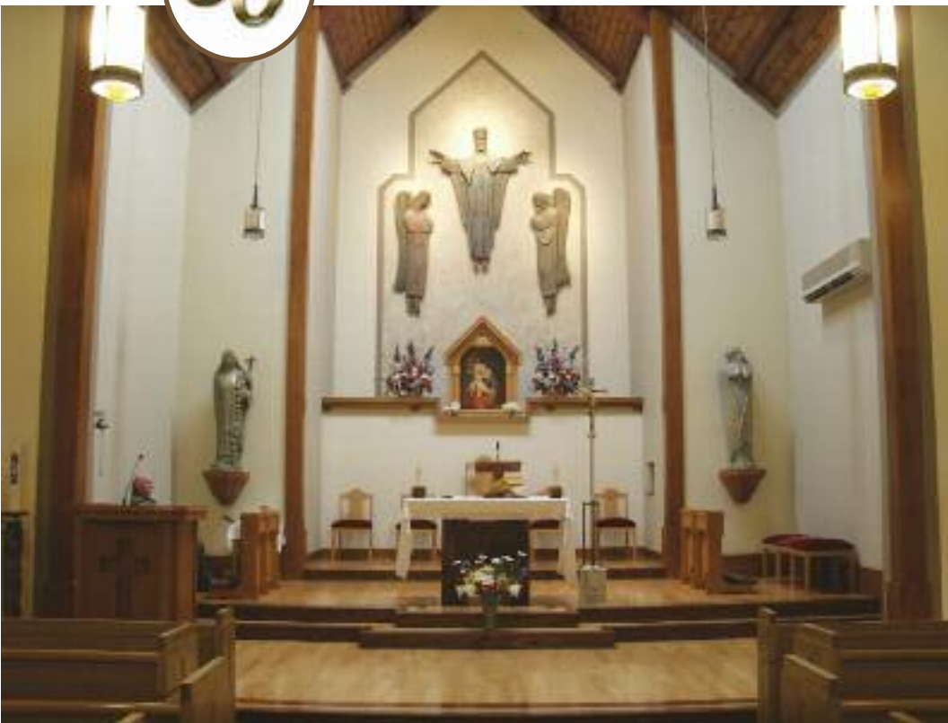
Notranjot cerkve Marije Pomagaj - prezbiterij

zbor Slovenskega letovišča , ki nadaljuje z dejavnostmi za vse tamkajšnje letoviščarje, mladino ter mnoge prijatelje in obiskovalce letovišča.