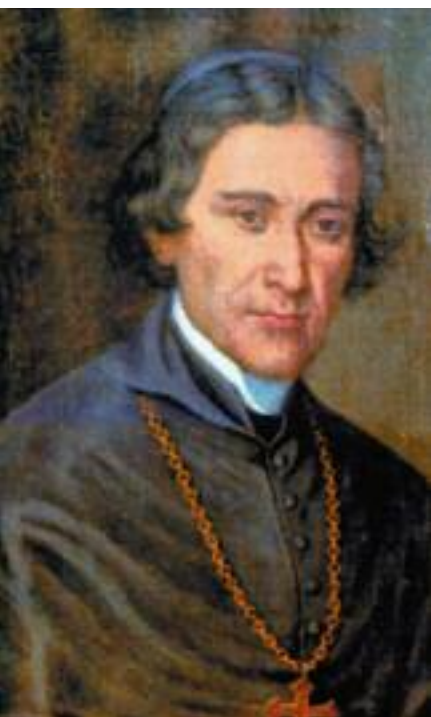
+ Frederic Baraga

Praznovanje Baragovih dni na krajih, kjer je božji služabnik deloval, vsakega romarja osebno nagovarjajo. Ne moreš si kaj, da bi se ne zamislil, kako je misijonar Baraga prepotoval velike razdalje dežele, ki sedaj nosi njegovo ime. Najsi bo hoja s krplji po snegu ali vožnja v ozkem kanuju po jezeru, njegova pot je bila namenjena indijanskemu človeku. Zanje je obiskoval Evropo in domovino, da bi jim kot dober pastir in škof priskrbel potrebnih misijonarjev in sredstev. Njegova skrb je bila Indijancem natisniti slovar in slovnico, jim tako dati samozavest in ovrednotiti njihovo zgodovino, značaj, šege ter običaje. Preko vsega tega jih je z dobro novico Jezusa Kristusa uspešno osvobajal praznovernega strahu.