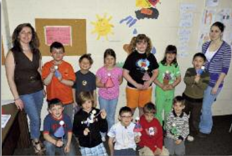
Prva stopnja, leto 2008-2009.

Pouk v Slovenski šoli je potekal v sedmih razredih. Starost otrok je bila od šest do dvanajst let. Učni program je vseboval učenje besednega zaklada, branje, slovnico, literaturo, zgodovino, zemljepis in glasbo. Učenci so po uspešno