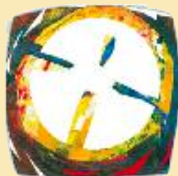
Logotip slovenskega evharističnega kongresa

Marija, evharistična Žena, prosi za nas!