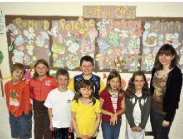
Druga stopnja, leto 2008-2009.