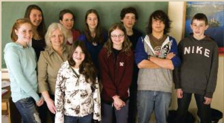
Deseti razred, leto 2008-2009.