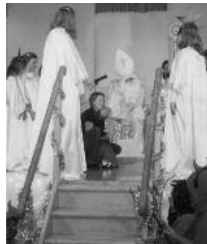
Sv. Miklavž s svojim spremstvom pri Brezmadežni

Imeli smo tudi polnočnico . Pred sv. mašo se je na koru oglasil cerkveni pevski zbor in s pesmijo popeljal navzoče vernike na Betlehemske poljane k