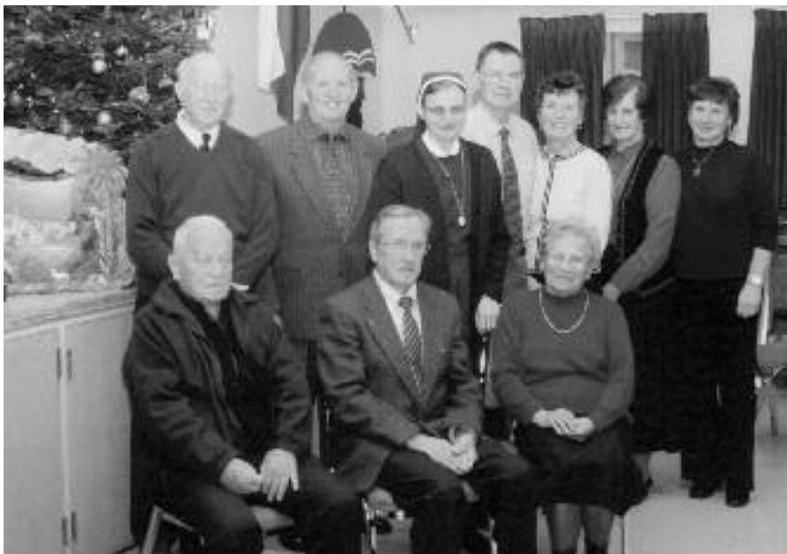
Odbor Vincencijeve konference ob jaslicah pri Brezmadežni