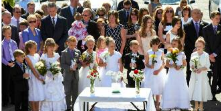
Prvoobhajanci pri župniji Sv. Gregorija Velikega