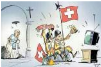
Švicarska garda navija za Švico, papež zadaj moli r. venec za Argentino