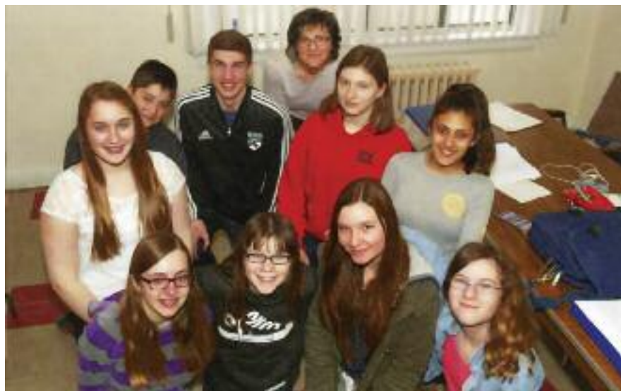
Skupina, ki so letos zaključili Slovensko šolo pri Brezmadežni