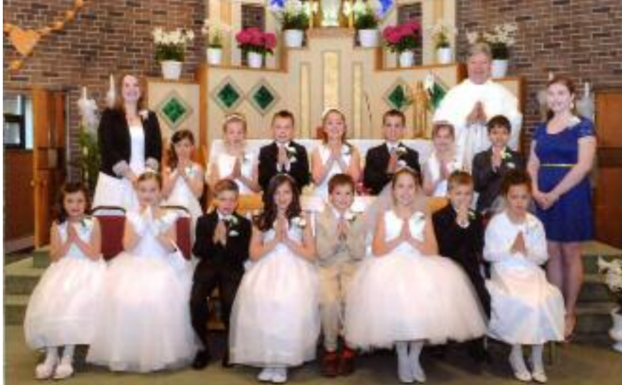
Prvoobhajanci pri Mariji Brezmadežni s čudodelno svetinjo

mesec. Za ta mesec velja pohvala vsakemu, ki se zato posebej rad udeleži svete maše.