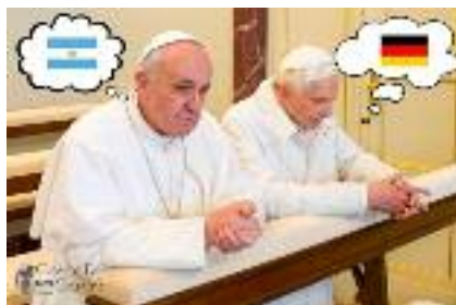
Finale: papež Benedikt moli za Nemčijo, papež Frančišek za Argentino