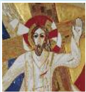
Vstali Kristus, iz mozaika kapele K. Roga

D ragi bratje in sestre v vstalem Gospodu! Ustvarjeni smo, da bi živeli, a nam vsak dan našega minevanja zelo zgovorno pričuje, da umiramo. In če umiramo zato, da bomo mrtvi, potem naše življenje nima pravega smisla.