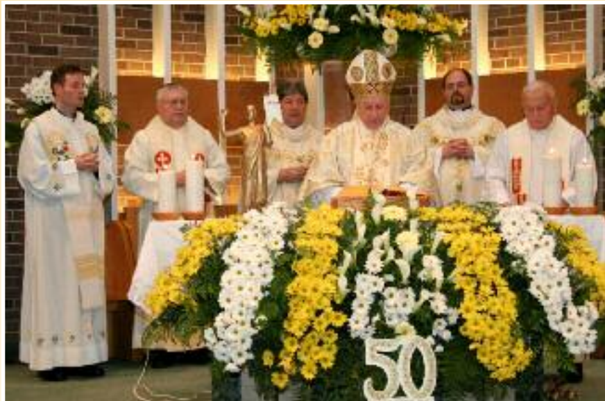
Somaševanje s kardinalom Francem Rodetom

Leta 1974 je povečal dvorano, dozidal novo nadstropje za šolo in razne organizacije. Rad je hodil na letovišče, kjer je maševal za izletnike, dal pa je tudi pobudo za gradnjo doma za ostarele. Za božič in veliko noč je vedno poskrbel za duhovno obnovo. Skrbno je pripravljajl otroke za prvo sv. obhajilo ter gledal, da je bil verouk v župniji reden in kvaliteten. Vrh vsega pa je še pisal nabožne knjige in jih izdajal pri Mohorjevi v Celovcu.