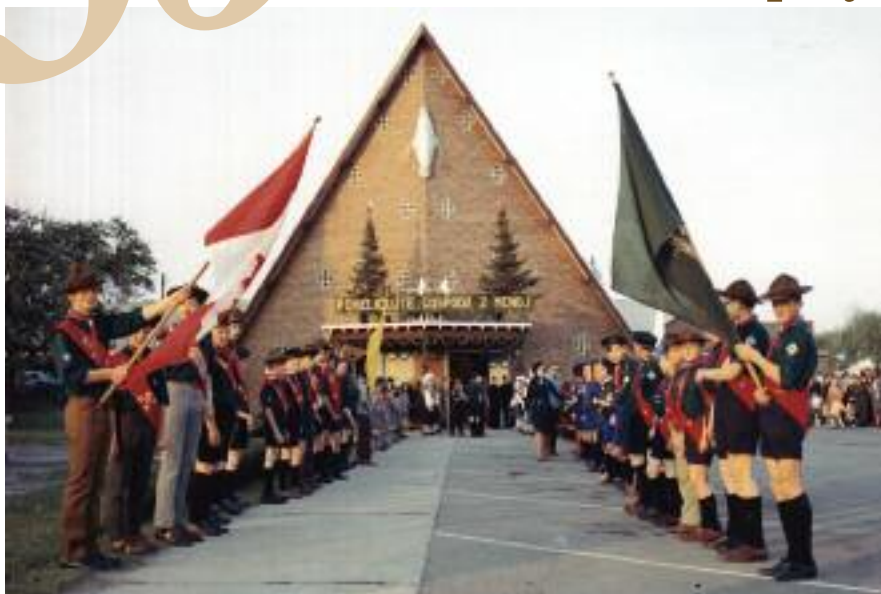
Slika iz arhiva, Skavtje pred cerkvijo

L eta 1948 so se tri večje skupine Slovencev preselile v Kanado. V začetku leta prva skupina deklet. Pri drugi in večji skupini nas je bilo 64 moških in fantov, ki smo prišli pod kontraktom popravljat železniško progo med Peterboroughom in Montrealom. Septembra je prišla še ena večja skupina deklet, ki so po večini bile dodeljene raznim imenitnim in premožnim družinam. Si predstavljate, kako smo bili fantje veseli in jim šli naproti v Montreal. Tako smo lahko ustanavljali nove Slovenske družine. V začetku največ v središču Toronta. Tam je bilo par vernih družin staronaseljencev, ki so prišli v Kanado pred drugo svetovno vojno in so bili do nas dobri.