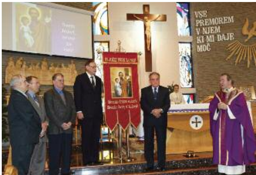
Nova bandera društva sv. Jožefa, Hamilton

znamenje, da je praznik svetega Jožefa, še posebej za člane društva, res poseben dan v letu.